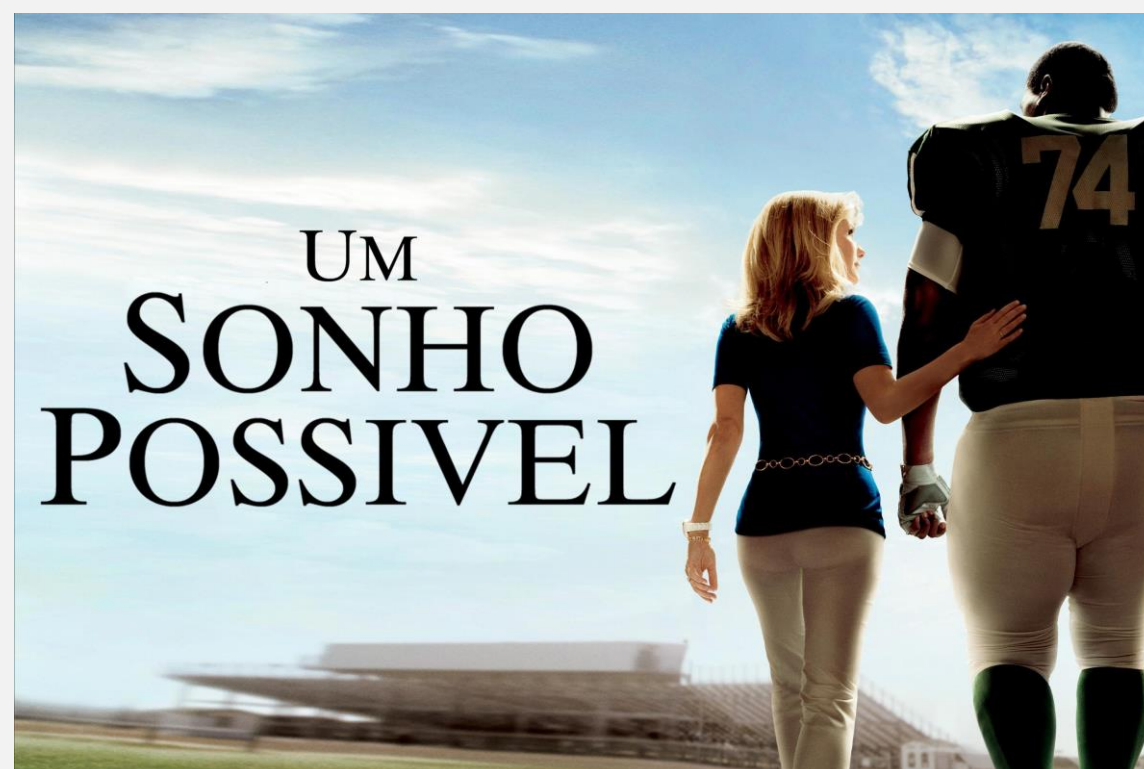
Dica de filme | Um Sonho Possível

Na história "A lição da árvore", um menino pergunta ao seu avô como se tornar bem-sucedido na vida. O avô conta uma história sobre duas plantas: uma plantada dentro de casa e outra plantada do lado de fora. Essa história nos convida a refletir sobre os desafios nos tornam mais fortes. A partir do vídeo, reflita como os desafios podem nos ajudar a alcançar o sucesso em nossa carreira. Clique aqui