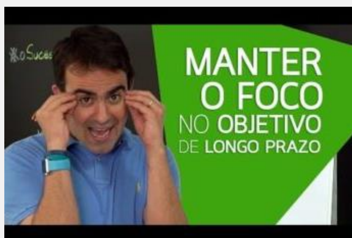
Vídeo : Plano de ação: o que é e como montar um

Este vídeo apresenta uma reflexão sobre a importância de enxergar a nossa vida e carreira como uma jornada de crescimento e aprendizado, destacando como cada experiência contribui para o desenvolvimento enquanto pessoa. Afinal, nossa passagem no mundo tem um final. Clique aqui