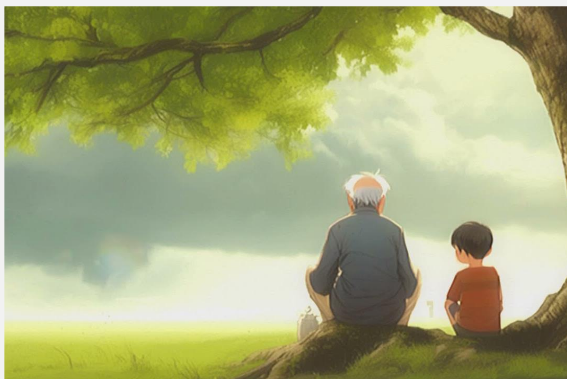
Vídeo | A Lição da Árvore e o Desafio do Sucesso

Um plano de ação é um guia detalhado que descreve os passos a serem tomados para alcançar um objetivo específico. Para montá-lo, defina claramente o objetivo, identifique as tarefas necessárias, estabeleça prazos e responsáveis, priorize as atividades e monitore o progresso regularmente, ajustando conforme necessário. Clique aqui