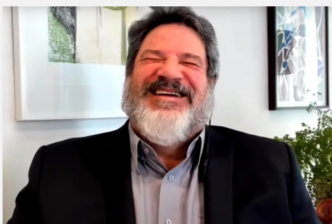
Vídeo | Mário Sergio Cortella | O tempo é vida

Para te ajudar a pensar esta jornada, compartilhamos nossa última curadoria da semana: